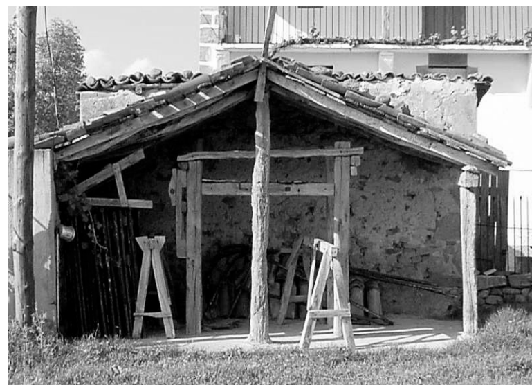
El potro de Quintanilla de Pienza en su estado original