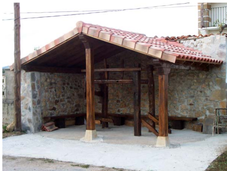
El potro de Quintanilla de Pienza en la actualidad

Tras décadas de inactividad, en el mes de agosto de 2006 se procedió a su restauración. Ésta consistió en la renovación de la estructura del local que lo protege y del tejado, así como la sustitución de varias piezas de madera deterioradas y la reposición de otras que le faltaban.